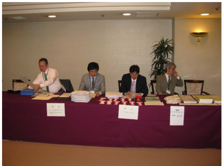
受付担当の総務企画委員。