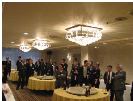
千葉監事より中締めのご挨拶をいただきました。