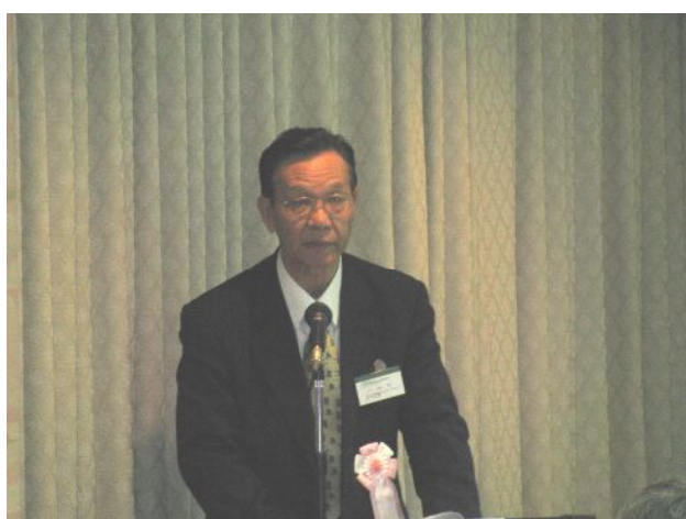
監査報告：千葉監事